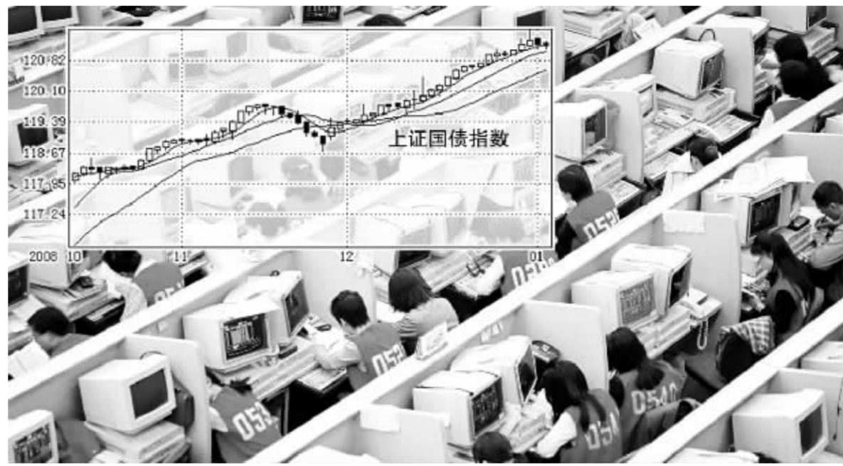
此轮债券牛市行情已持续约4个月,各期限债券收益率已接近前期历史低点。 张大伟 制图